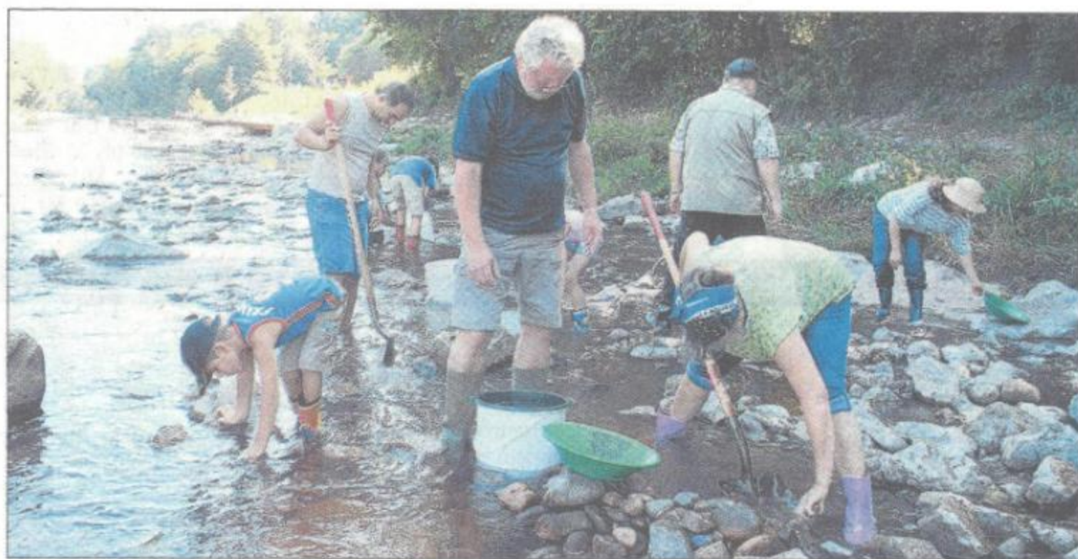
Bei der zu erwartenden Ausbeute ist viel Idealismus gefragt, denn: Goldwaschen ist Schwerstarbeit.

„Gold liegt nicht dort, wo sich ausschließlich Sand ab-